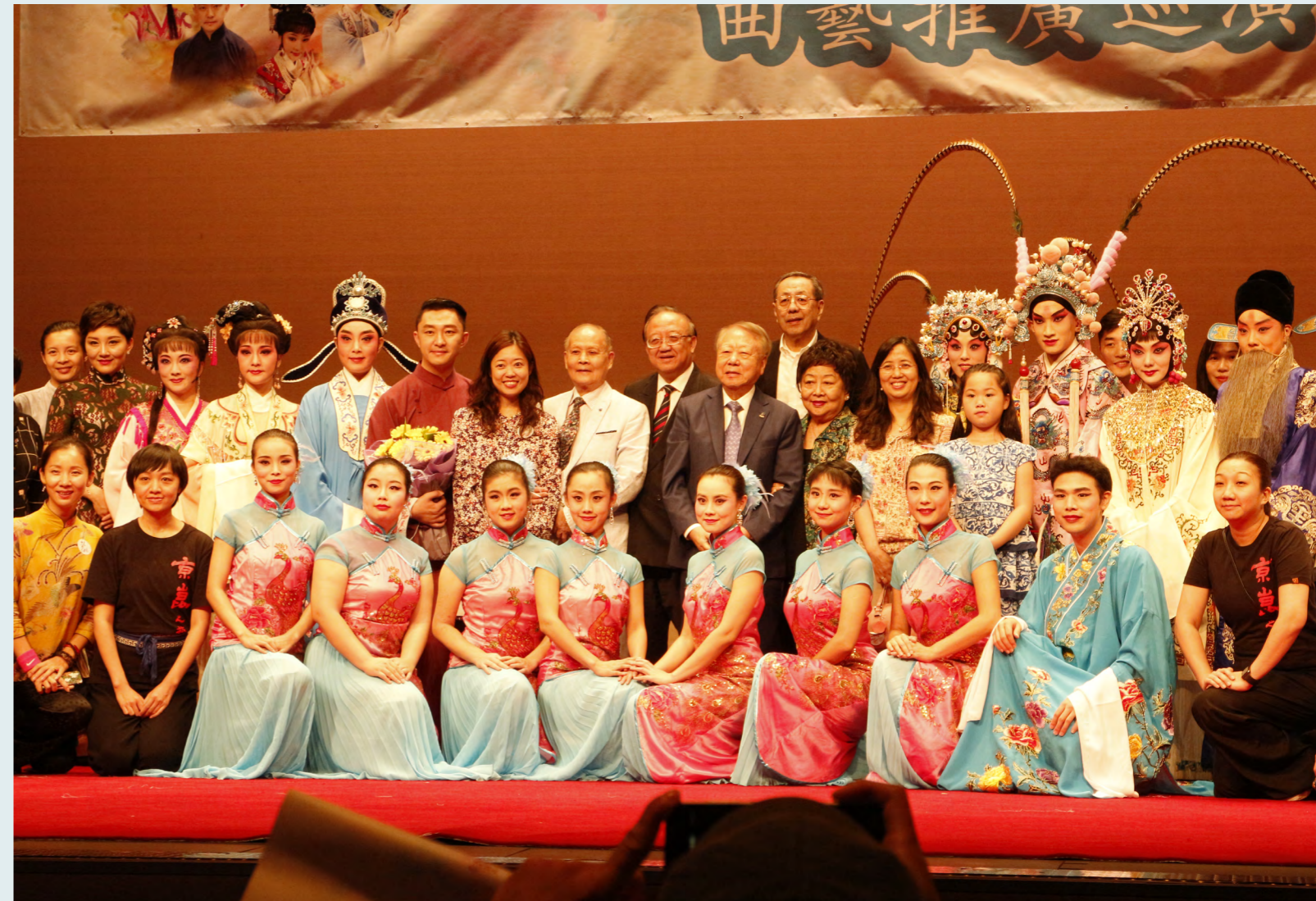
二〇一七年「姹紫嫣紅」校園巡演合照

五個學期中，在戲校戴國良、潘潔華、石曉珺以及上海崑劇團張頌等諸位老師的悉心教授下，崑曲班同學學習了《牡丹亭·驚夢》、《孽海記·思凡》、《牡丹亭·拾畫》等折子戲中的片段。顧博士、顧太太、李博士從來不嫌我們表演的稚嫩，總是鼓勵大家，還每年策劃「姹紫嫣紅」校園巡演，並不斷尋找其他演出機會，使每位同學都能踏上台板，透過實踐強化所學。正如周志剛老師所說，崑曲表演訓練「排十遍不如響一遍，響十遍不如演一遍」。除了上課和訓練，顧博士還會為大家開設講座或拍曲。每逢有京崑名角來港演出，先生們也會買票給同學觀看。