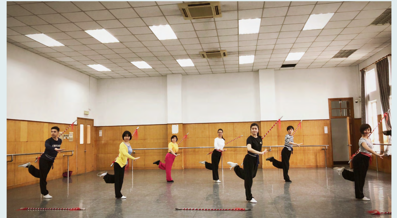
二〇一八年戲校集訓，由戴正昆老師主教把子課

用一劑治心安神的良藥。忘掉已知、概念、經驗，放棄舊思維，用空容器接納新訊息，在傳統文化中是「虛己」的功夫。