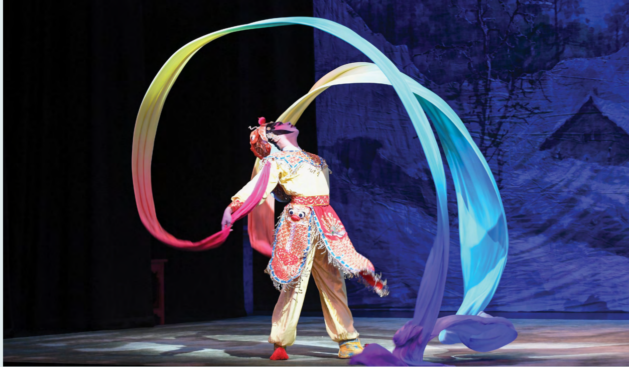
中國民間傳奇專場《王祥臥冰求鯉》(2017)