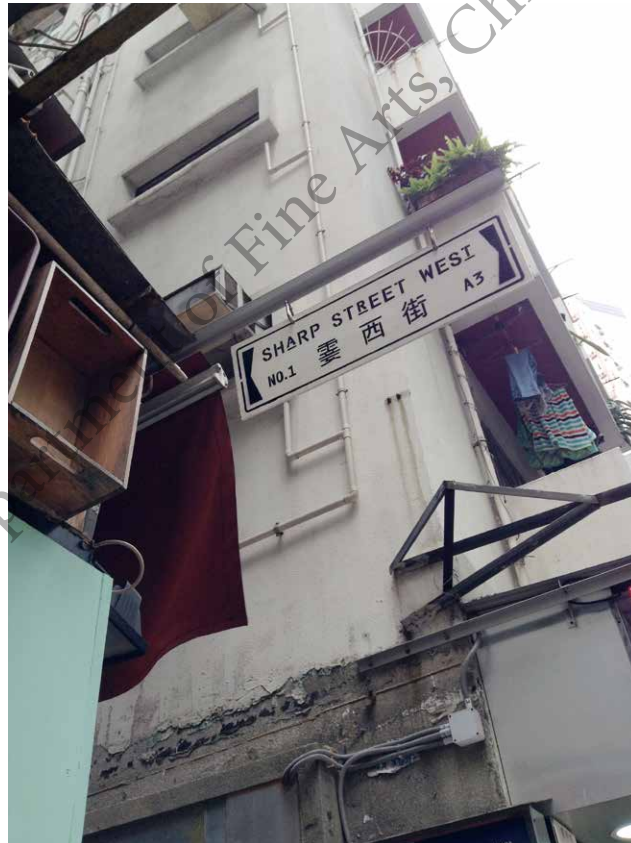
圖三 霎西街 1 號 A3 舖。

位於銅鑼灣內街梯舖的霎西街 1 號 A3 舖（圖三、四），由楊陽創辦，於 2015 年成立，在一次偶然的機會下，楊自資租用這個梯舖，原有目的偏向滿足個人對藝術的追求。空間隙小主要作展示作品，展覽或展演在隙小的櫥窗內發生，途人或觀眾只能透過櫥窗觀看，甚至不能久留，旨在該地方有些「東西」正在發生，部分的展演活動如「IN SESSION 3 - Enoch CHENG」需要預約，模式類似活化廳「隔窗有嘢（See Through）」，強調藝術家與主辦方在創作過程上的交流對話，並將之以文字方式記錄，上載到場地網站。