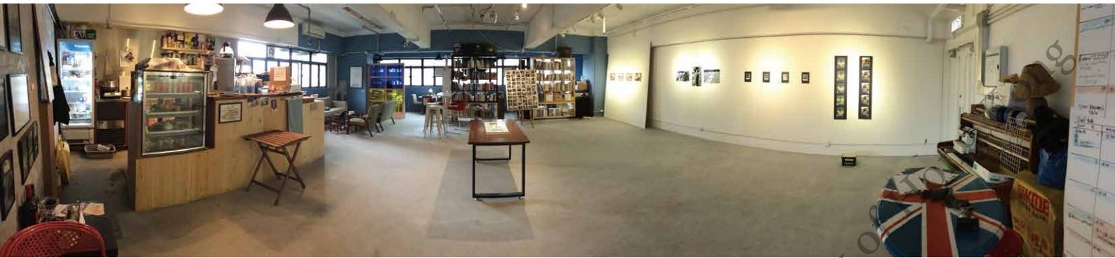
圖五 「據點。句點」。