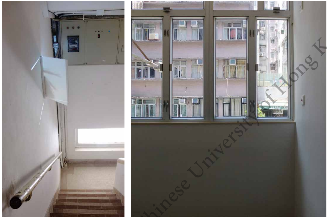
圖七（左）、圖八（右） 「咩事」。