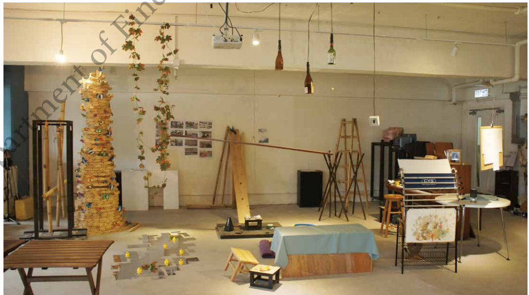
圖六 「據點。句點」。圖片由 據點。句點提供。

王鎮海引述這個例子，帶出實際空間能發揮作用，直接影響藝術家的參與及藝術實踐。另一方面，他們沒有申請任何資助，免除許多因資助而附帶的行政工作，工作也變得簡單直接。他們也沒有加入「南港島藝術區」（South Island Cultural District）成為會員，但卻聚集了一些藝術家成為「藝術群體」，漸漸為人認識。