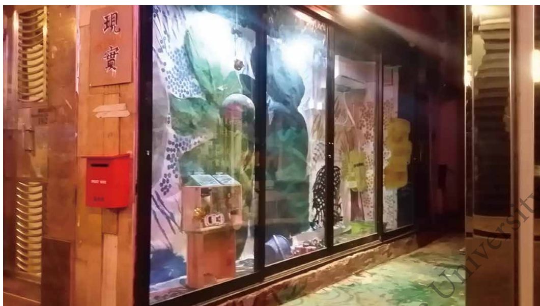
圖四 葵西街1號A3舖。